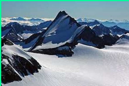
Hintere Schwärze (3.624m)