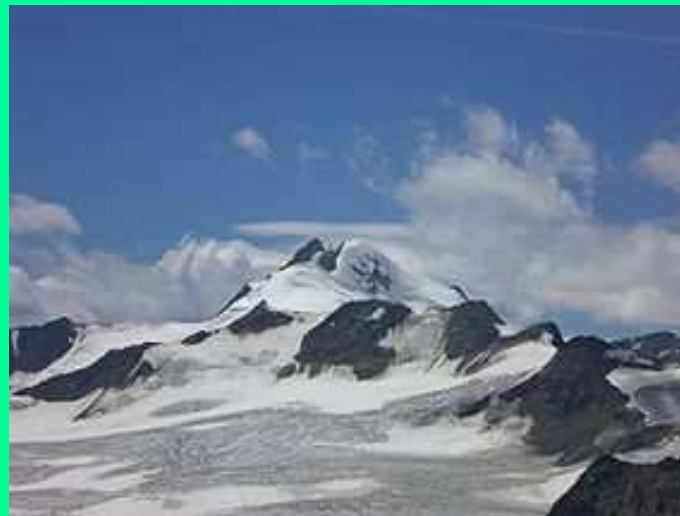
Wildspitze (3.770m) 2.Höchster Berg Österreichs