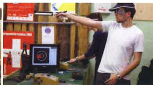
Zwei Teilnehmer aus Ungarn