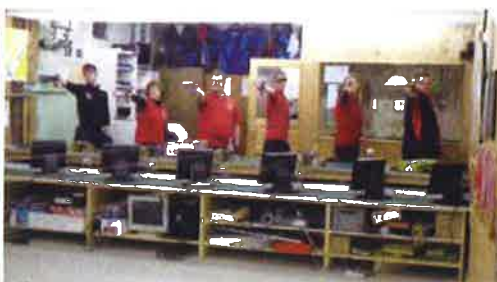
Slowenische Mannschaft aus Pettau