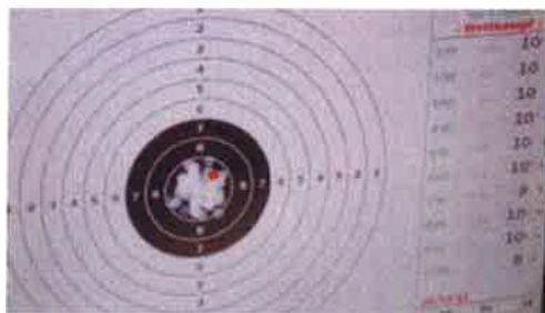
Das beste Ergebnis in Raaba (Stundrekord 581 von 600 Treffern, Sportschiessen Luftpistole Olympischer Bewerb).