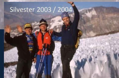
Silvester 2003 / 2004